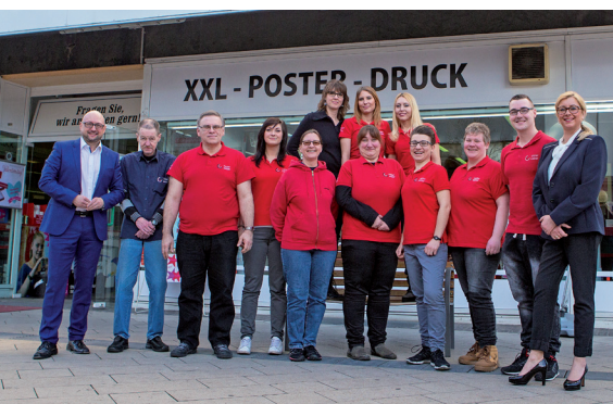
Das Team von Copiercenter Dortmund arbeitet mit dem neuen Stempelshop von Schmorrd.

www.copiercenter-dortmund.de www.schmorrd.de